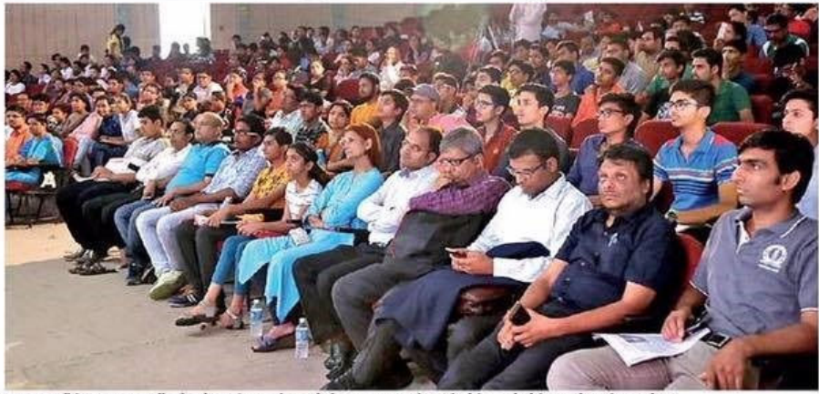
ंउदयपुर । दैनिक भारकर और टेक्नो इंस्टीट्यूट के साड़ो में एमएलएसयू के ऑडिटोरियम में सेमिनार में उपस्थित लोग।

दैनिक भारकर और टेक्नो इंस्टीट्यूट के साझे में एमएलएसयू ऑडिटोरियम में हुआ सेमिनार